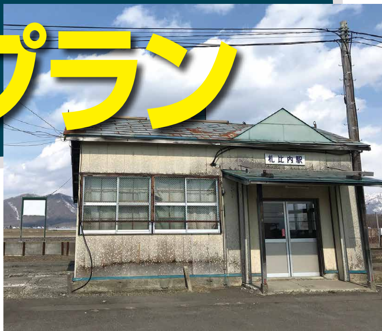
▲札沼線には「秘境駅」と呼ばれる無人駅も...