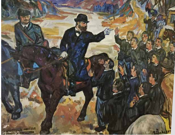
洋画家・田中忠雄作「島松での別離」(道赤レンガ庁舎内)

「ボーイズ・ビー・アンビシヤス」と言い残して札幌農学校（現北海道大学）初代教頭のウイリアム・スミス・クラーク博士が去った「別れの地」である旧島松駅通所（北広島市島松）のある場所を中心に馬上のクラーク像を建立しようという運動が高まりを見せている。2年後の2022年秋の建立を目指し、来春から募金活動などを本格的にスタートさせる。